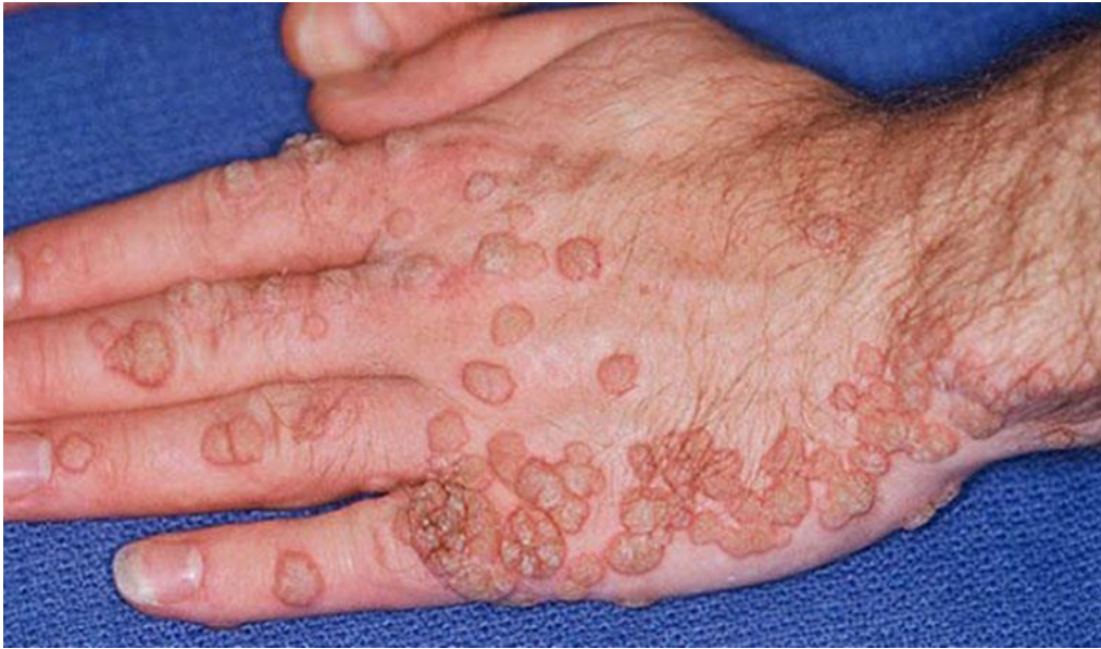
Hình ảnh sùi mào gà giai đoạn đầu hình thành tại bàn tay