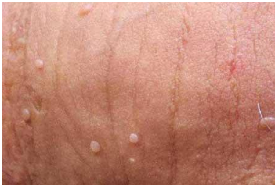
Bệnh lí sùi mào gà (benh-sui-mao-ga-la-gi)

Trung tâm kiểm soát và phòng ngừa dịch bệnh Mỹ (Centers for Disease Control and Prevention - CDC) cảm thấy rằng có tới 50% nữ giới và nam đã từng đời sống chăn gối nhiễm HPV tối thiểu một lần trong đời. Virus sùi mào gà cũng là đối tượng làm tăng khả năng bị ung thư cổ tử cung cũng như ung thư bộ phận sinh dục nam. Do vậy, các bạn phải tự trang mắc cho mình các thông tin y khoa về Bệnh sùi mào gà cũng như những loại bệnh do virút HPV dẫn tới (nói chung) để phòng bệnh cho chính mình và bạn tình.