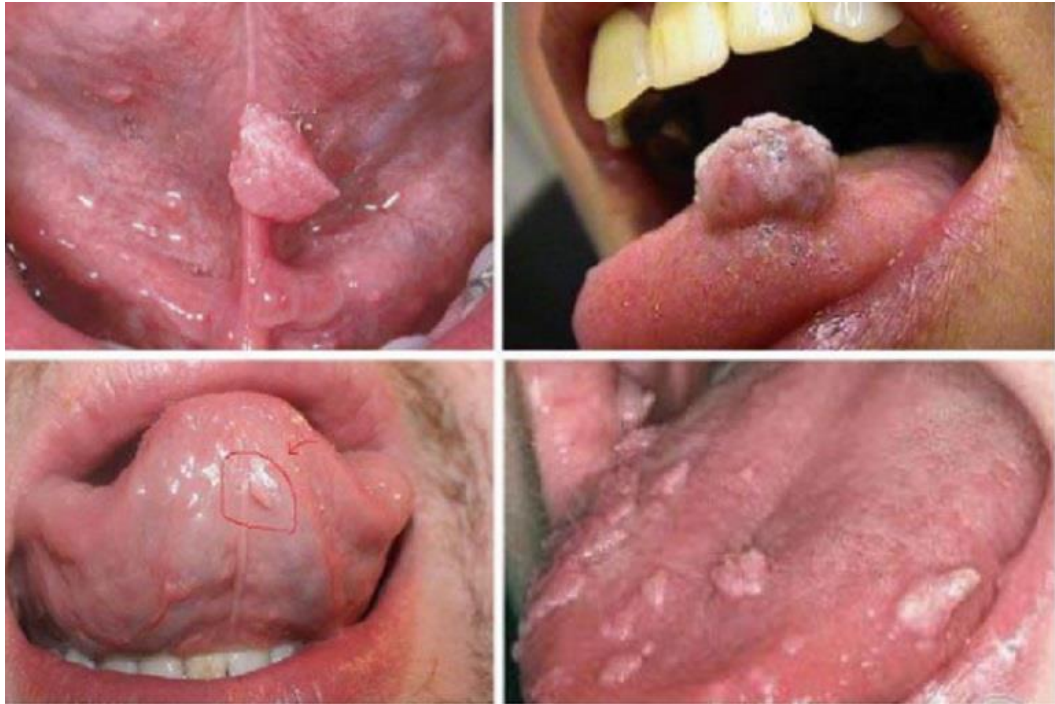
Hình ảnh sùi mào gà giai đoạn đầu ở miệng