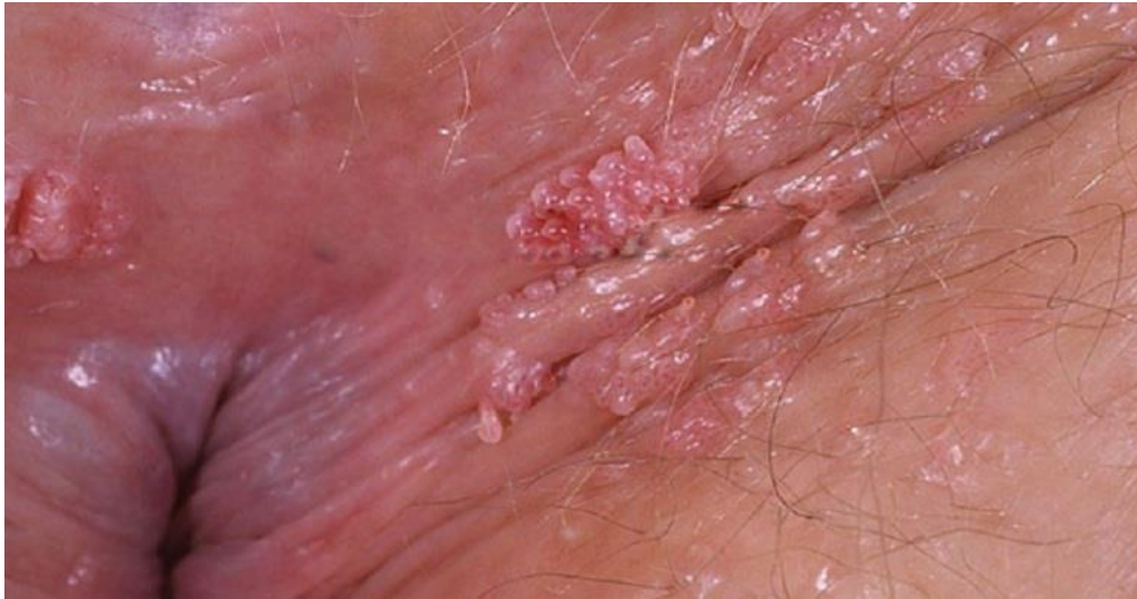
Hình ảnh trĩ máu gà giai đoạn đầu ở hậu môn