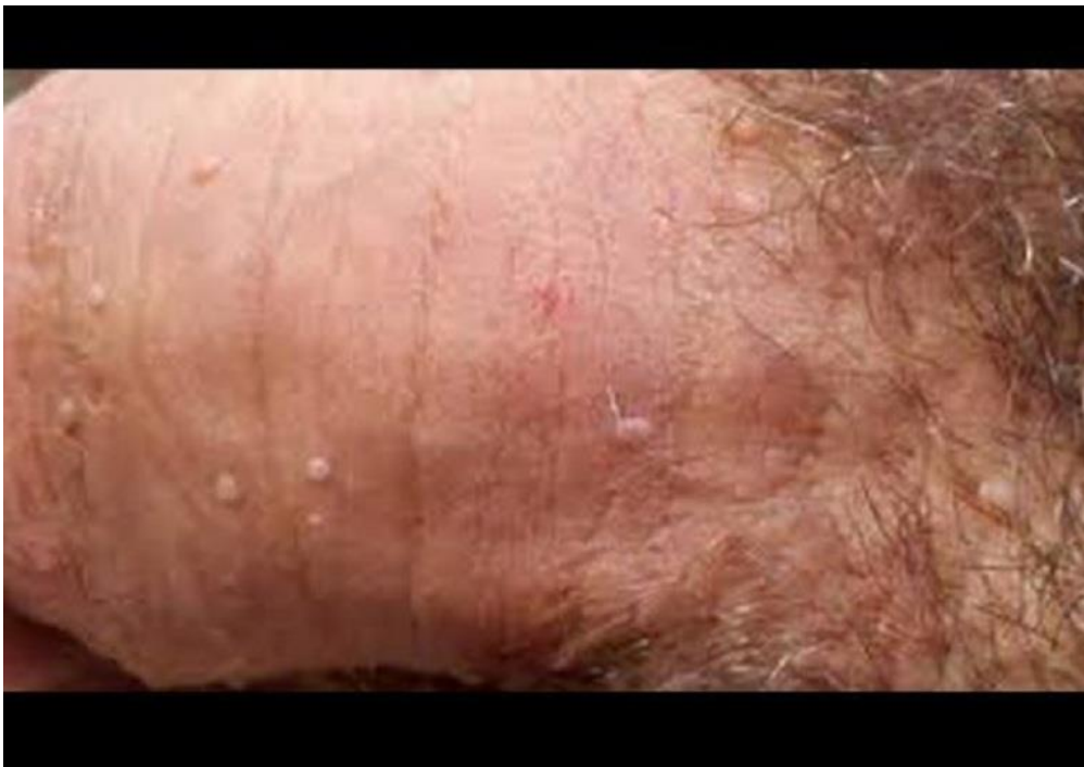
Hình ảnh sùi mào gà giai đoạn đầu tại vùng nhạy cảm