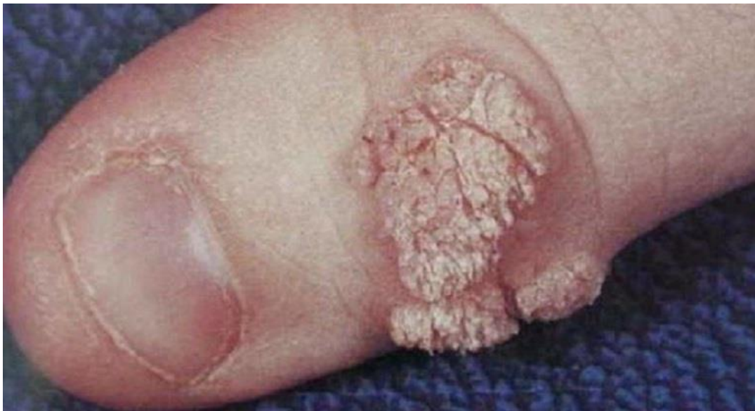
Hình ảnh sùi mào gà giai đoạn sớm tại tay